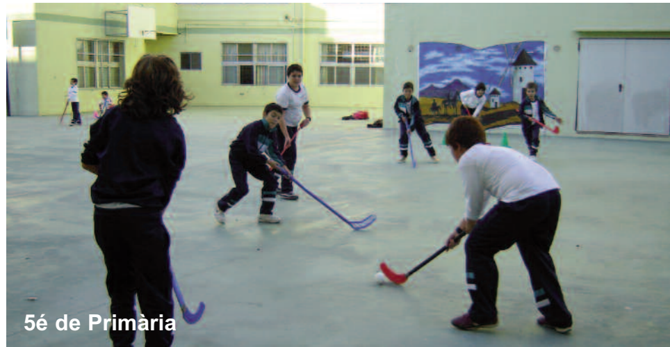
5é de Primària