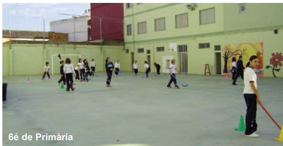
6é de Primària

Es tracta de promoure la pràctica de l'hoquei com alternativa a les pràctiques esportives tradicionals i una millora de les capacitats coordinatives dels alumnes mitjançant un element de control com l'estic i també per treballar habilitats bàsiques com la conducció, les passes, les parades o recepcions i la combinació de totes aquestes